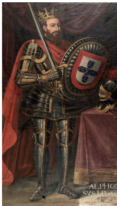
Fig. 2. Retrato de D. Afonso Henriques (autor desconhecido)

Os significados atribuídos pelos estudantes a tal imagem refletem, recorrentemente, uma visão histórica tradicional e exemplar, marcada pelas orientações convencionais que «definem a “unidade” dos grupos sociais ou das sociedades [...] e mantêm o sentido de uma origem comum» 566 e pelas regras atemporais.