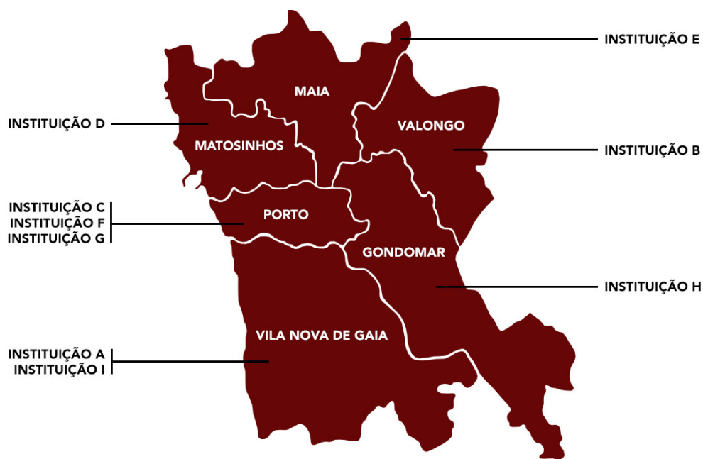
Fig. 1. Os concelhos do distrito do Porto onde se localizam as instituições educativas

portanto, muitos deles beneficiários de apoio social escolar. No Projeto Educativo salienta-se o intuito de que os diferentes espaços que a compõem sejam vividos e sentidos como «lugar de vida/de oportunidade/de encontro». As grandes finalidades que norteiam as ações concretizadas são a educação para os valores, a promoção do sucesso educativo, o combate ao abandono escolar e a promoção da literacia.