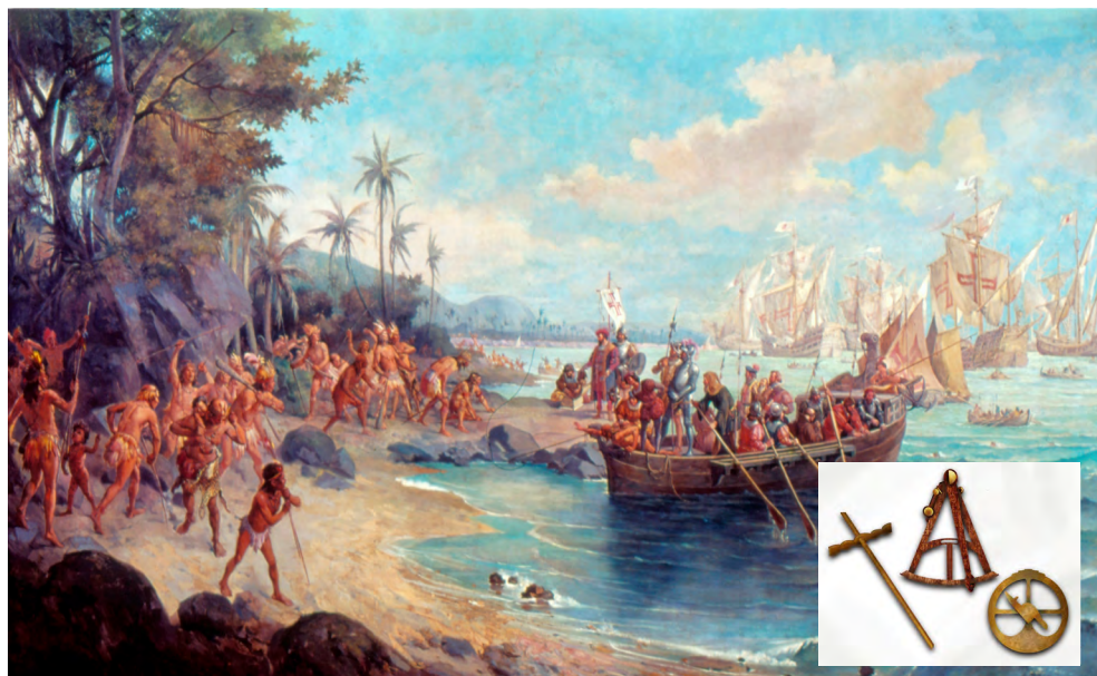
Fig. 3. Desembarque de Pedro Álvares Cabral em Porto Seguro, em 1500 (Óscar Pereira da Silva, 1904) 570 ; instrumentos náuticos (criação digital de Mariana Carneiro, 2022)

De alguma forma, as tradições, e a moral como tradição, contribuem para a compreensão e definição de uma identidade histórica partilhada e a História surge «como algo didático» 571 , até porque «os portugueses aventuraram-se, sem saberem o que podia acontecer».