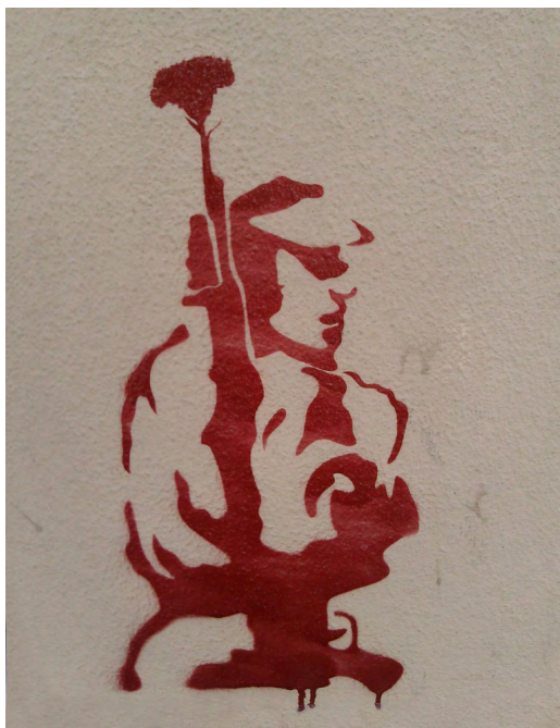
Fig. 5. Militar durante a Revolução de 25 de abril de 1974 575

como «o mais importante de Portugal». Porventura ligando implicitamente a data ao evento histórico, e numa resposta algo parcial, cerca de três dezenas de inquiridos apenas registaram «25 de Abril» como legenda da imagem.