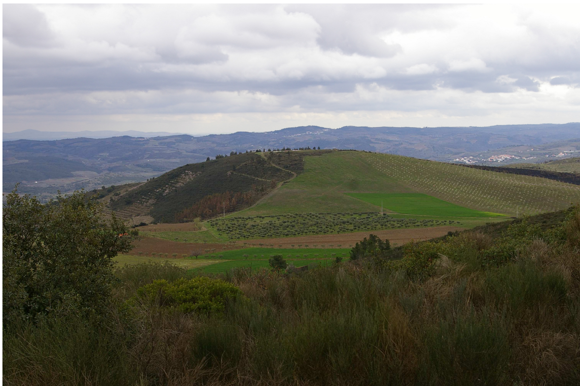
Figura 2. Colina monumental de Castanheiro do Vento. (fotografia de João Muralha).

arqueológicas têm vindo a realizar-se anualmente, geralmente durante o mês de julho contando com a presença de inúmeros estudantes nacionais e estrangeiros.