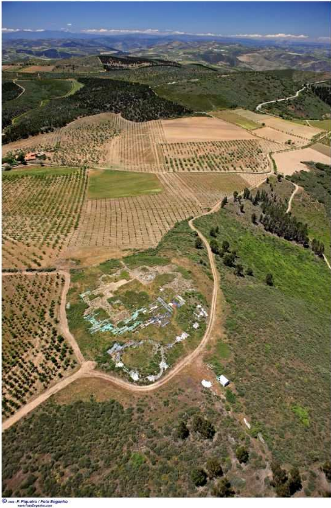
Figura 3. Fotografia aérea do topo do morro de Castanheiro do Vento (Direção Regional de Cultura Norte, 2008).